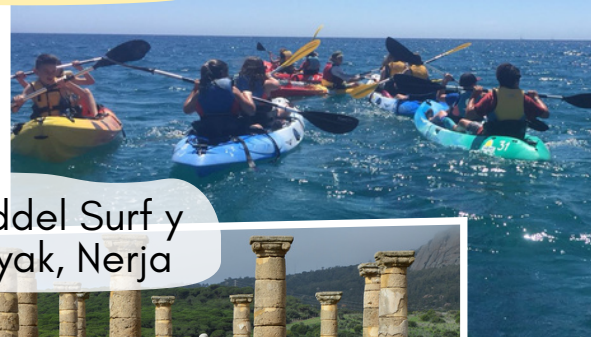
Paddel Surf y Kayak, Nerja