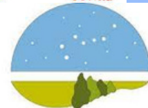
PARQUE de las CIENCIAS MÁLAGA GRANADA