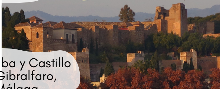
Alcazaba y Castillo de Gibralfaro, Málaga