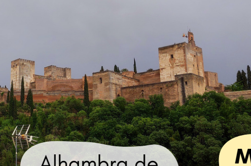
Alhambra de Granada