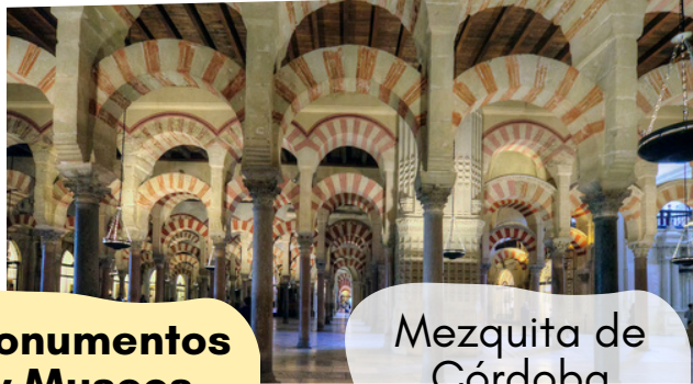
Mezquita de Córdoba