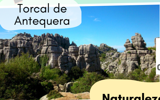
Torcal de Antequera

Si lo que buscas es salir y volver en el mismo día, sin necesidad de dormir fuera de casa, te ofrecemos una variedad de actividades deportivas, culturales y de ocio para vuestro grupo.