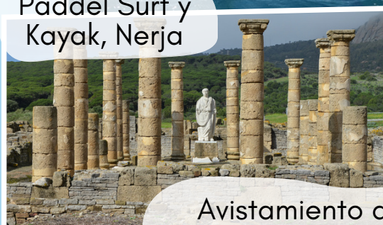
Avistamiento de Cetáceos y Visita Baelo Claudia, Tarifa